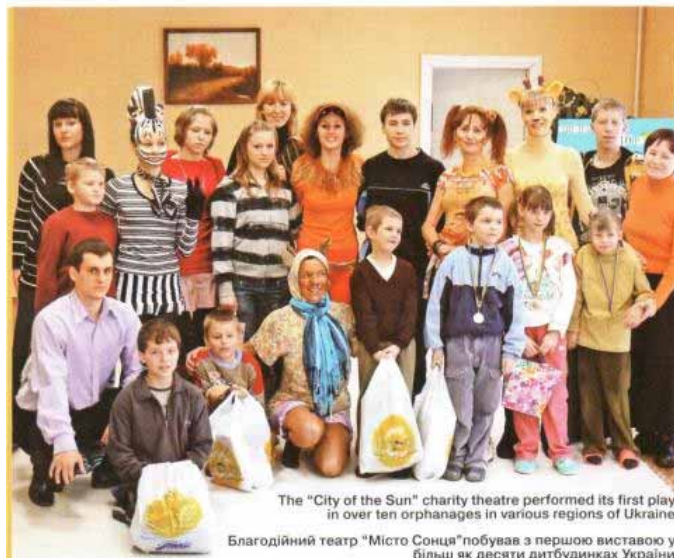
The "City of the Sun" charity theatre performed its first play in over ten orphanages in various regions of Ukraine Благодійний театр "Місто Сонця" побував з першою виставою у більш як десяти дитбудинках України

"Мадагаскарці в пошуках Нового року" – так називалася перша вистава, яку театр "Місто Сонця" підготував минулої зими лише за декілька тижнів. В основу сценарію покладено сюжет американського мультфільму "Мада-