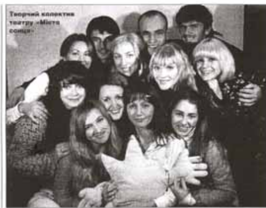
Театральний колектив театру «Місто сонця»

– Випускаємо спочатку з'являються самі, – каже Наталя. – Вироджує трішки тяжко готувалася, а відрозу після Нового року побігла зі спектаклем до